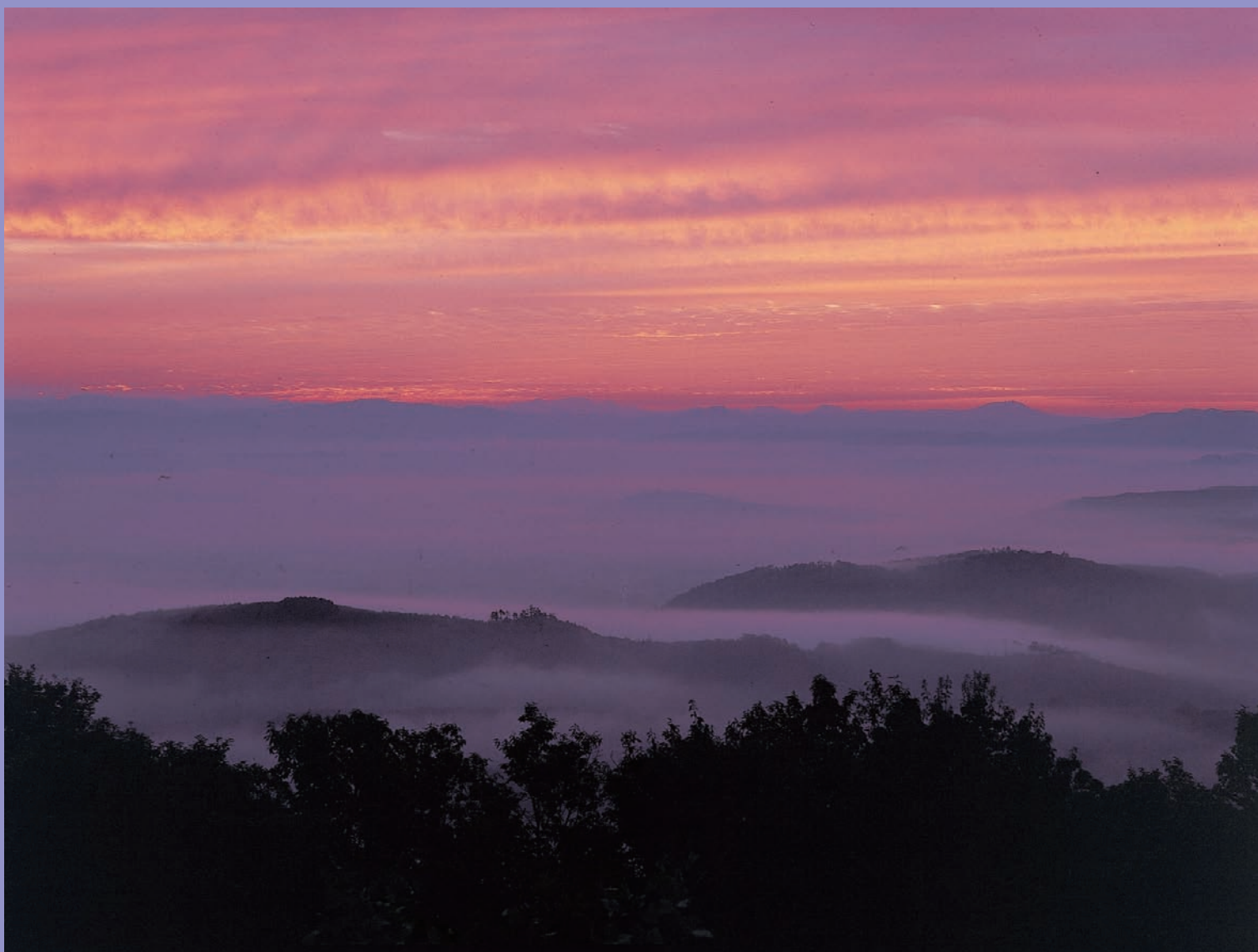
高谷山霧の海（三次市）