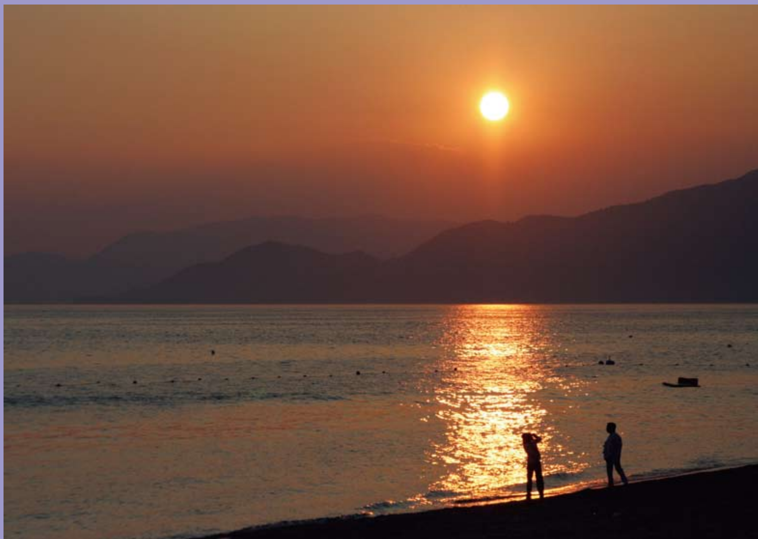
広島湾の秋日（江田島市）